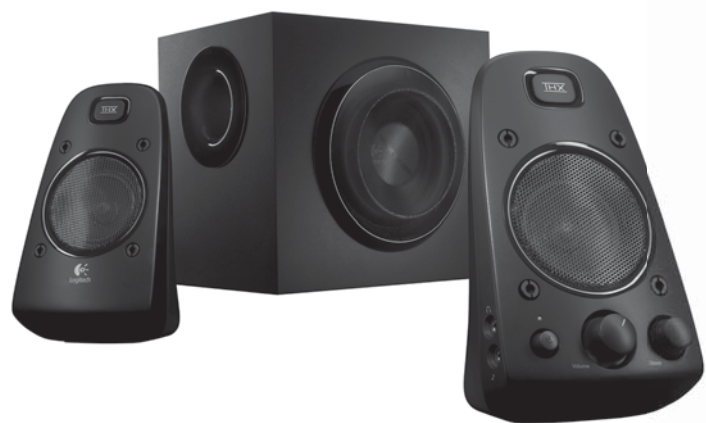
Model: S-00105 (110V~) S-00104 (220-240V~)