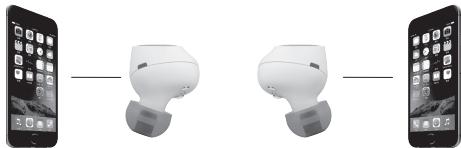
First device + Left AntiPods 1er appareil + AntiPods Gauche